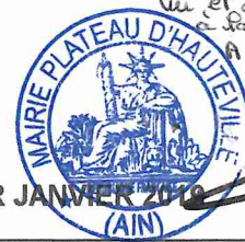
TABLEAU DES EMPLOIS PERMANENTS AU 1ER JANVIER 2019

Vu et accepté, pour être annexé à la délibération de ce conseil le 31/01/2019 Le Maire,