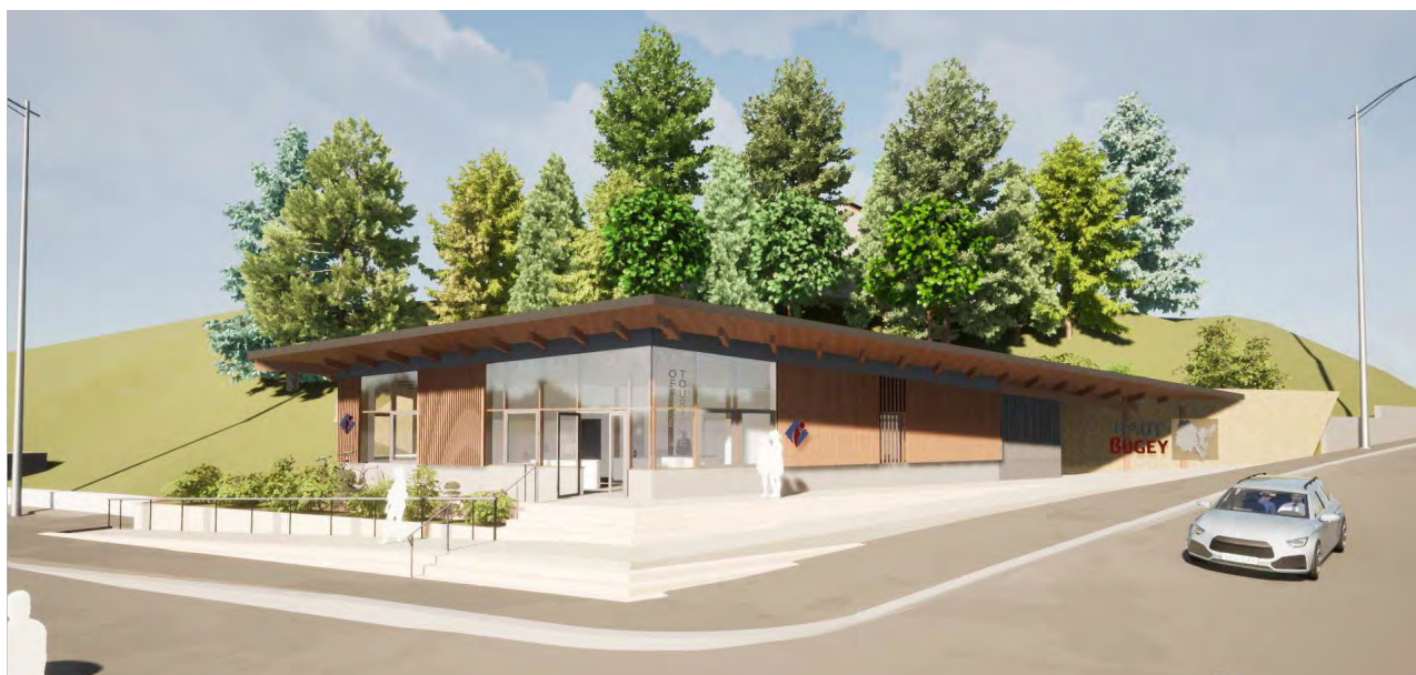
projet de construction du bureau d'accueil de Haut-Bugey Tourisme